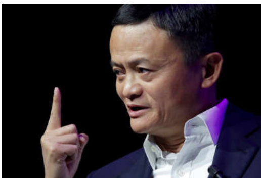
แจ็ก หม่า (马云, Jack Ma)

“ ถ้ามีกระต่าย 9 ตัวในสวน... และคุณอยาก...จับมันสักตัว งโฟกัส...สักตัว ”